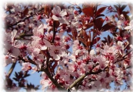
Śliwa wiśniowa „Pissardi”