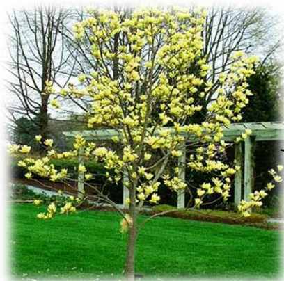
Magnolia „Yellow Bird”