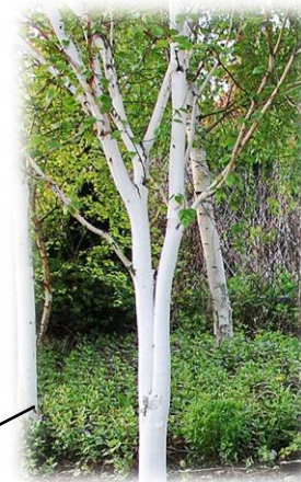
Brzoza pożyteczna „Doorenbos”