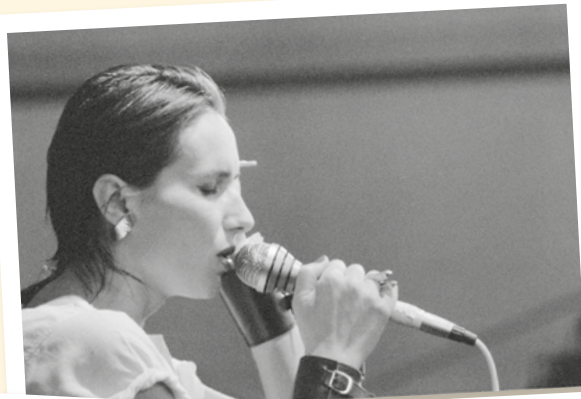
Maanam w katedrze w 1985.

Festiwal muzyczny w Jarocinie po raz pierwszy odbył się już w latach 70. XX wieku. Jednak największą sławę zdobył dopiero w latach 80., gdy stał się największym festiwalem muzyki rockowej w bloku wschodnim. Znany także pod nazwą „Festiwalu Muzyków Rockowych”, powstał z inicjatywy Waltera Chełstowskiego i był odskocznią od szarej, przygnębiającej rzeczywistości. Zasady cenzury nie były przestrzegane (zwłaszcza na początku lat 80.), więc artyści mieli nieograniczoną możliwość wyrażenia frustracji i buntu. Jarocin stanowił jedyne w swoim rodzaju miejsce dla grup niezależnych muzycznie. Tylko tam mogły liczyć na większą publiczność. Grano głównie rock, heavy metal, reggae czy blues. Festiwal zdominował jednak punk rock, budząc sensację wśród młodych ludzi ze względu na swoją odrębność subkulturową. Na scenie występowały takie zespoły jak: T.Love, Dżem, Dezerter, Republika, TSA, Sztynny Pal Azji