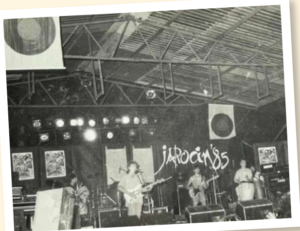
Idee Five na Dużej Scenie podczas Festiwalu Jarocin 1985.

i nie tylko. Wykonawcy mieli szansę debiutu i promocji swoich singli muzycznych. Publiczność przyjmowała ich ciepło, utożsamiając się z wartościami przekazywanymi w piosenkach. Jarocin, oprócz pełnienia funkcji „czysto muzycznej”, był także miejscem rozwoju opozycji wobec systemu władzy, co zauważyło SB interesując się festiwalem od 1983 roku. Jarocin zachował jednak niezależność muzyczną, malując barwny obraz wielu subkultur, które