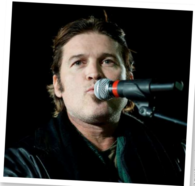
Billy Ray Cyrus

Jednym z największych wydarzeń muzycznych okazał się koncert na cześć Freddiego Mercury’ego, który odbył się 20 kwietnia na arenie Wembley w Londynie. Wydarzenie miało na celu upamiętnić zmarłego pod koniec 1991 roku wokalistę, a całą kwotę zebraną podczas organizacji koncertu przeznaczono na cele charytatywne. 72 tysiące biletów wyprzedano się w zaledwie dwie godziny. Wśród gwiazd, które wystąpiły na koncercie, znaleźli się Guns N’ Roses, Elton John czy Metallica.