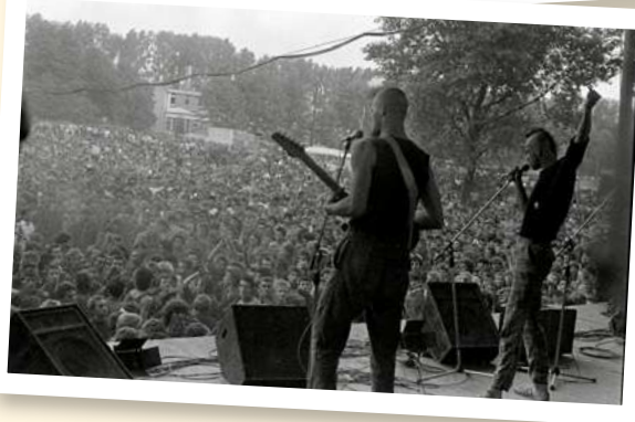
Koncert zespołu Stekiera na Festiwalu Muzyków Rockowych w Jarocinie (4 sierpnia 1984).

miały możliwość otwartego sprzeciwu wobec władzy. W późniejszych latach, Solidarność rozdawała tutaj ulotki szerzące wartości opozycyjne do systemu władz komunistycznych. Festiwal stał się miejscem formowania się nowego społeczeństwa, złożonego z młodych ludzi chcących zmian w tamtejszej Polsce.