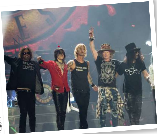
Guns N' Roses

„Jednym z największych wydarzeń muzycznych okazał się koncert na cześć Freddiego Mercury’ego, który odbył się 20 kwietnia na arenie Wembley w Londynie.”