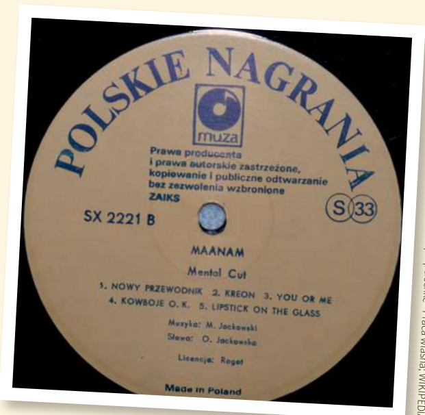
„Mental Cut” – Winyl Long Play Polskie Nagrania SX 2221 Label side B.