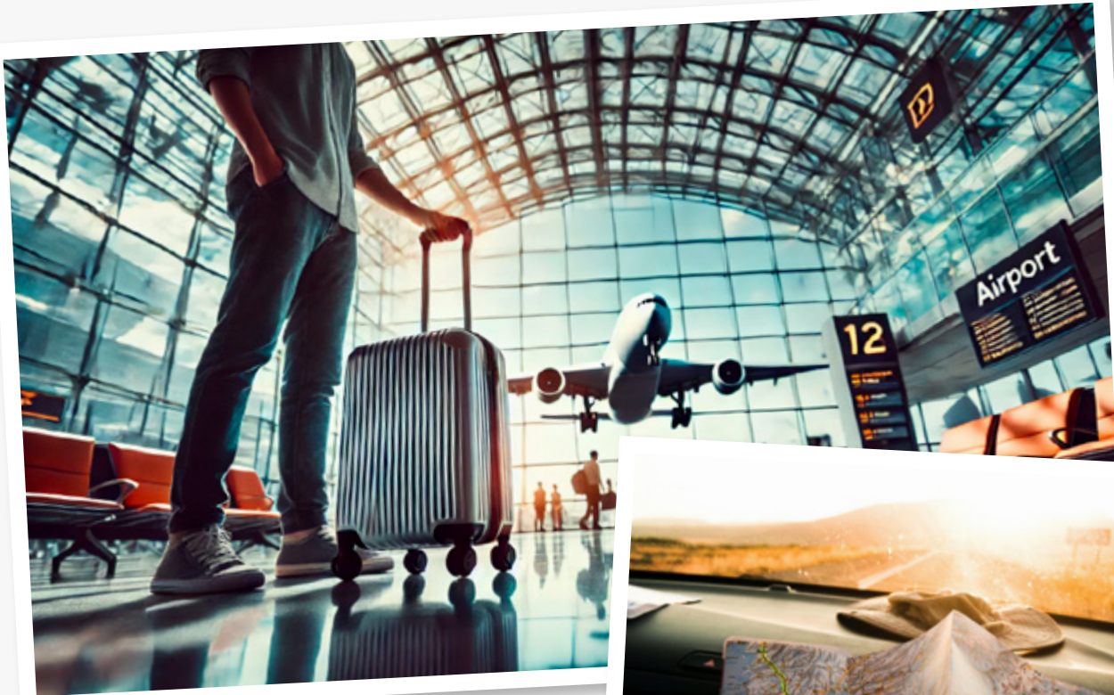
Zdjęcie wygenerowane przez DALL-E.

Dzięki nowoczesnym rozwiązaniom podróżowanie stało się bezpieczniejsze i bardziej komfortowe.