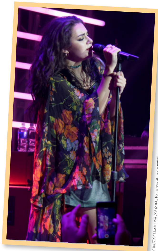
Charli XCX na koncercie VMA (2014); Fot. Justin Higuchi WIKIPEDIA

Inną piosenkarką, która zapoczątkowała trend w reklamach, jest Charli XCX i jej nowy album „Brat”. Dzięki piosence Brytyjki możemy przeżyć „brat summer”, a pełnię doświadczeń uzyskamy podróżując Flixbusem w charakterystycznym limonkowym kolorze, dokładnie jak na okładce płyty. W te wakacje nazywamy go „brat busem”. Nie jest to pierwsza kampania przewoźnika adresowana do pokolenia Z. Profil Flixbusa na Tik-Toku słynie ze śmiesznych filmików pokazujących duży dystans do marki. Podobnie promuje się Duolingo – na profilu firmy możemy znaleźć filmiki nawiązujące między innymi do igrzysk olimpijskich, gdzie maskotki przebrane są w stroje różnych drużyn. Duolingo wyznaje także miłość Dua Lipie (zbieżność imion nieprzypadkowa). Kultowa sowa wykreowała swój wizerunek poprzez „prześladowanie” osób, które nie korzystają codziennie z aplikacji. Ciągłość nauki (codzienne wykonywanie zadań) jest jednym z głównych założeń promowanych przez firmę. Dlatego, pomimo nietypowej metody, sowa-prześladowniczka zachęca do skutecznej nauki języka.